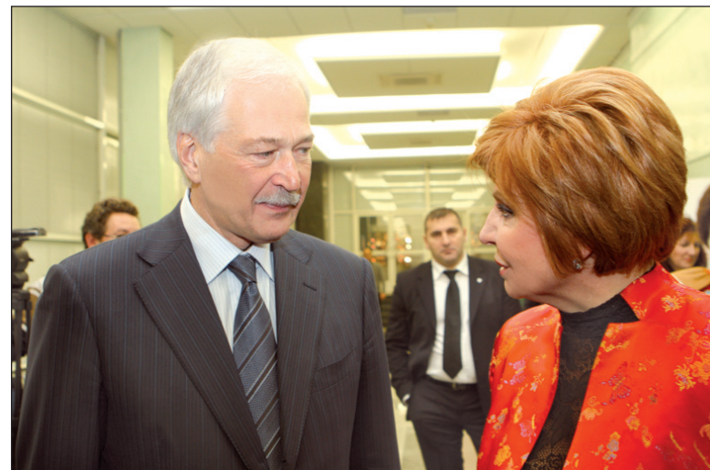
Деятельность Всероссийского педагогического собрания находит поддержку председателя Государственной Думы РФ Бориса Вячеславовича Грызлова.