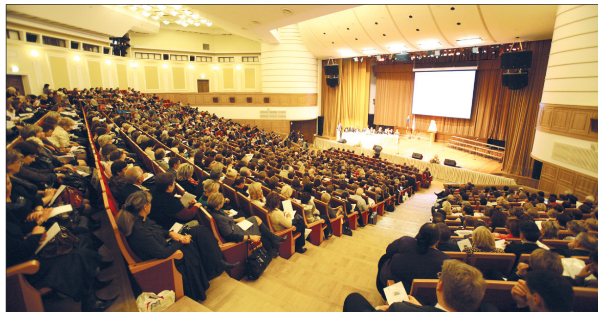
Москва. Апрель 2010 года Первый московский международный конгресс учителей.