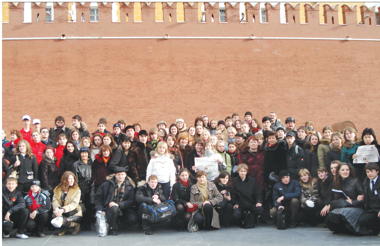
Февраль 2008 года. Участники Всероссийского слета детских и юношеских общественных организаций "Мы - будущее России" у Кремлевской стены.