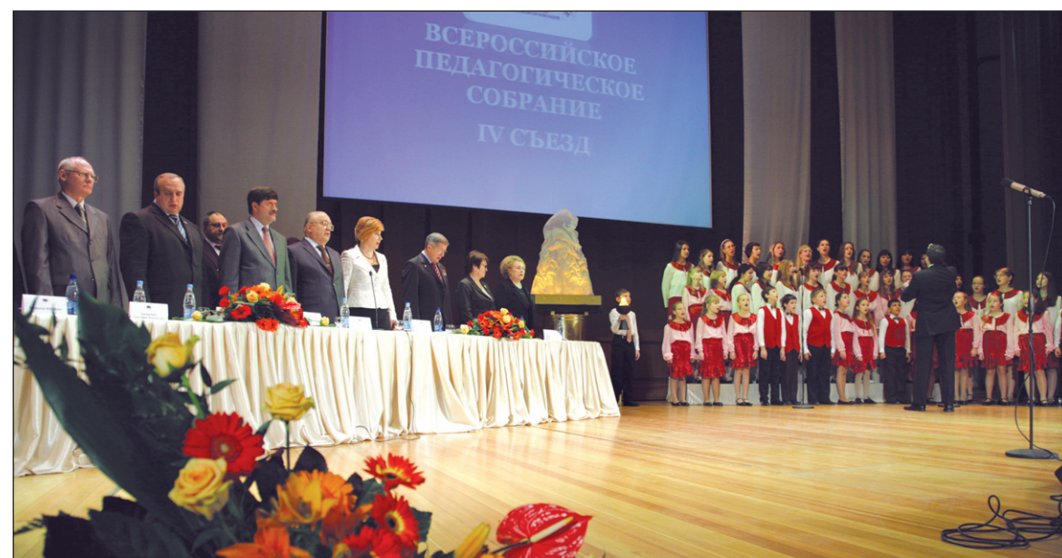
Октябрь 2008 года. Фундаментальная библиотека МГУ им. М.В.Ломоносова. IV съезд ВПС