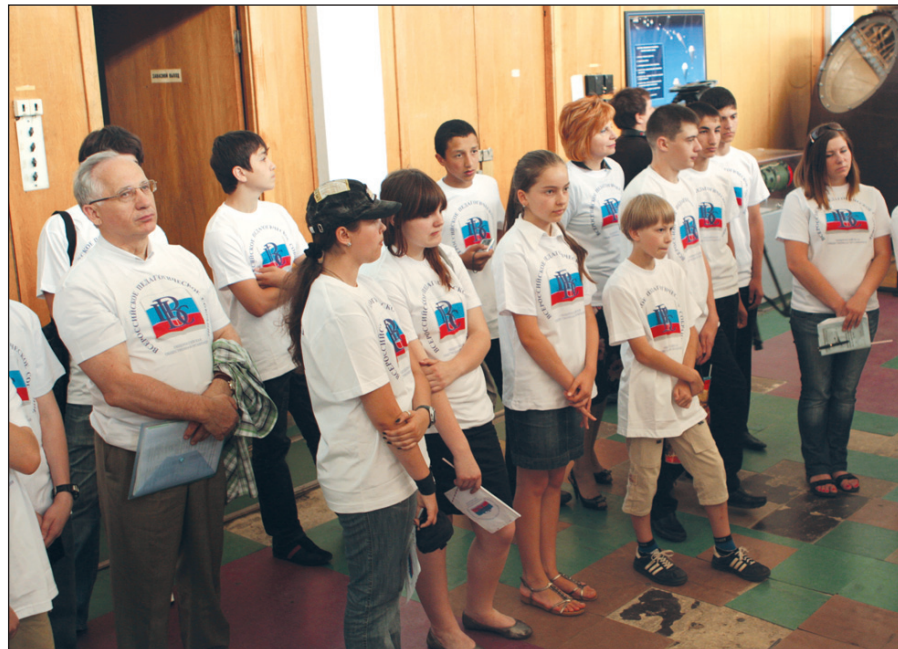
Июнь 2009 года. Звездный городок. Победители конкурса "Наследники Ю.А.Гагарина"