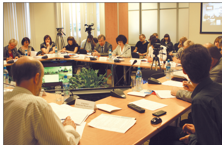
Центр социально-консервативной политики ВПС "Единая Россия". ВПС обсуждает и дает экспертную оценку проекту закона "Об образовании"