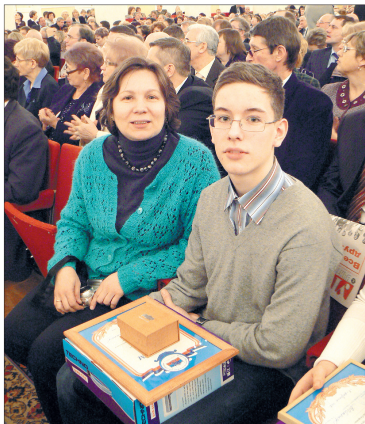
Москва. Колонный зал Дома союзов. III съезд ВПС.