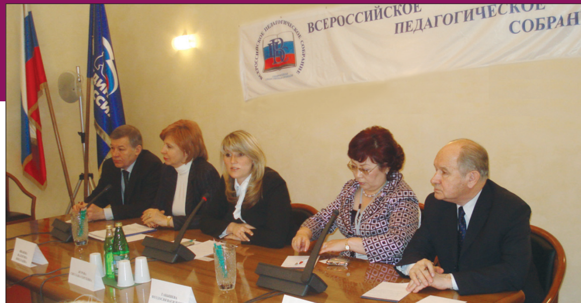
Одно из заседаний круглого стола в Государственной Думе