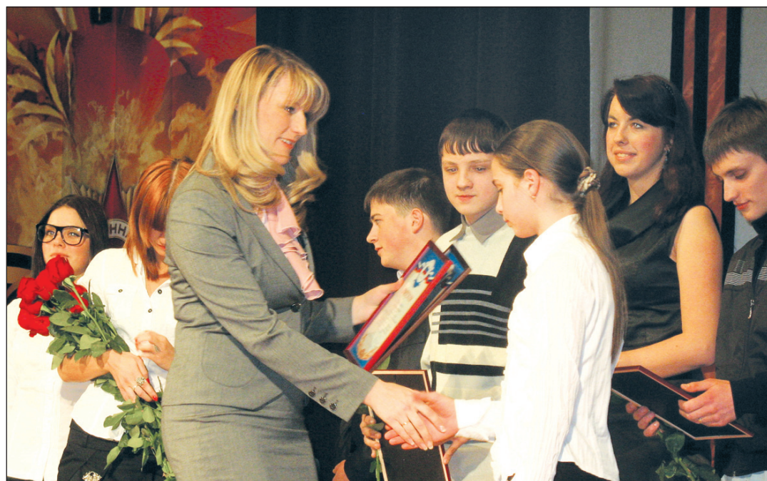
Первый московский международный конгресс учителей. Заместитель председателя Государственной Думы Светлана Журова вручает награды победителям конкурса ВПС "Сохраним историческую память"