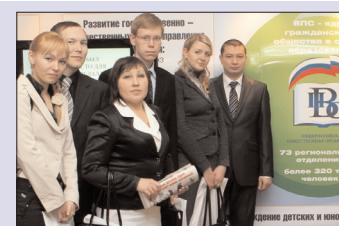
Молодой учитель в социальном векторе России. Заметки с форума - стр. 4-5