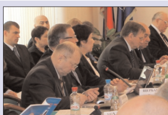
МГУТУ им. К.Г.Разумовского провел научно-образовательный форум - стр. 3