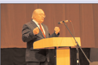
В.А.Садовничий на форуме молодых учителей - стр. 2