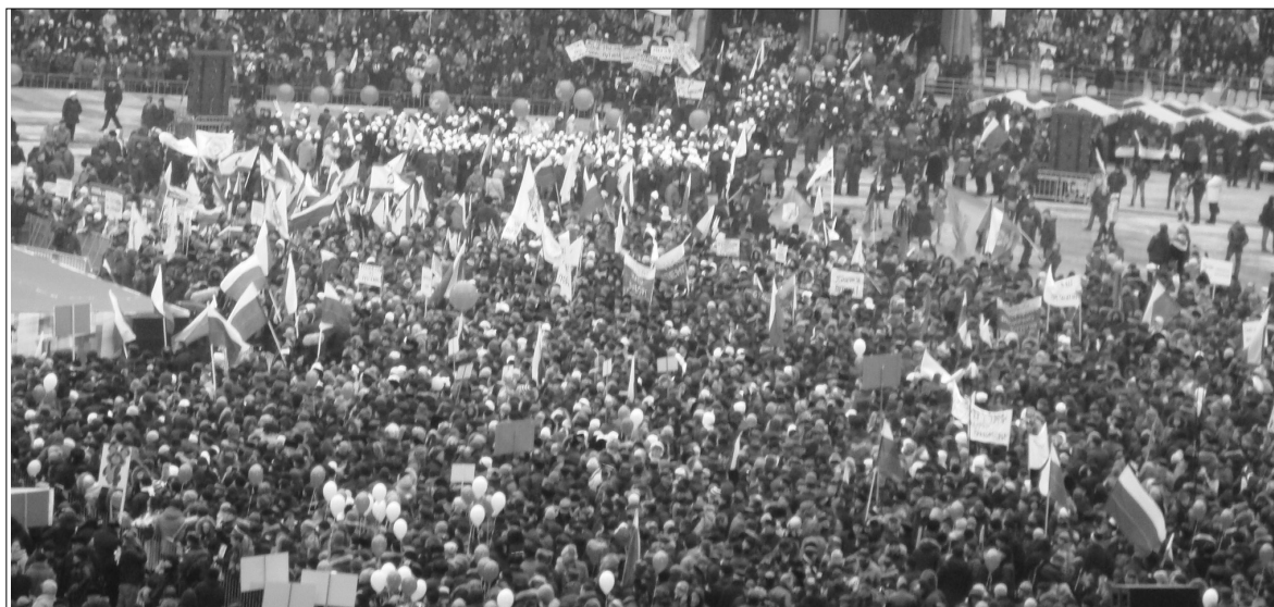
Педагогическая общественность страны под руководством своих региональных отделений ВПС активно поддержала Владимира Владимировича. По всей стране прошли митинги в поддержку Путина.

вания. Информация, полученная в ходе работы "горячей линии", помогла выявить определенные недоработки в работе региональных и местных органов управления образованием. Как это было, к примеру, в Приморском крае, где проблемы учителей пришлось решать на самом высоком уровне в Москве.