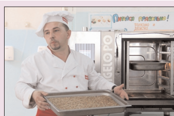
Бренд-повар из Москвы провел мастер-класс в Ульяновске - стр. 4