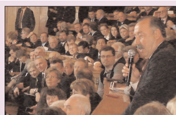
Хабаровский край. Педагоги сплотили ряды - стр. 3