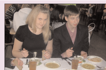
Школьному питанию - знак качества Пензенский опыт здоровьесбережения - стр. 6